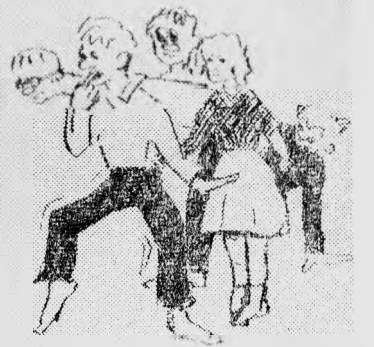
Редактор В. ШАРШАКОВ.