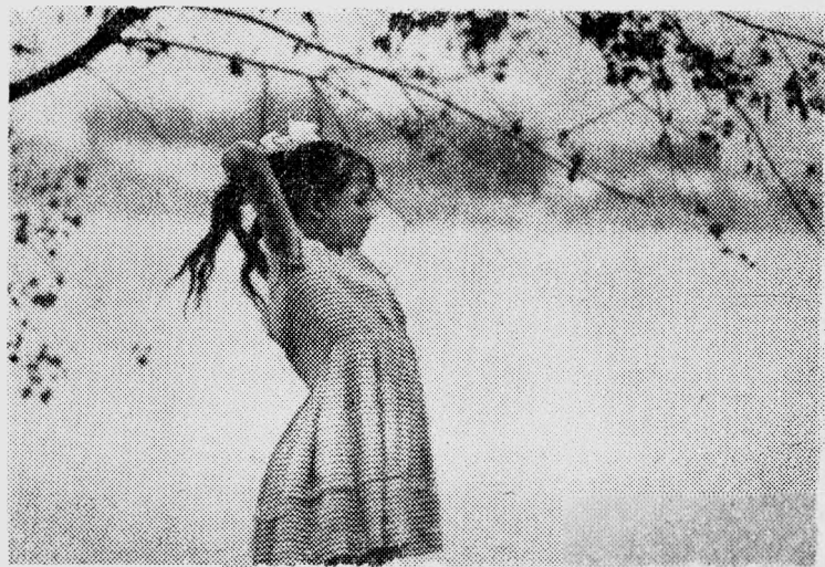
Портрет в пленере.